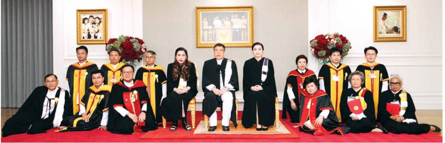
พระบาทสมเด็จพระเจ้าอยู่หัว และสมเด็จพระนางเจ้าฯ พระบรมราชินี พร้อมด้วย สมเด็จพระเจ้าน้องนางเธอฯ กรมพระศรีสวางควัฒน วรขัตติยราชนารี ทรงฉายพระบรมฉายาลักษณ์ร่วมกับคณะผู้บริหาร ม.ธรรมศาสตร์

หัวข้อข่าว: ในหลวง-พระราชินี เสด็จฯไปทรงเปิดอาคารกิติยาคาร