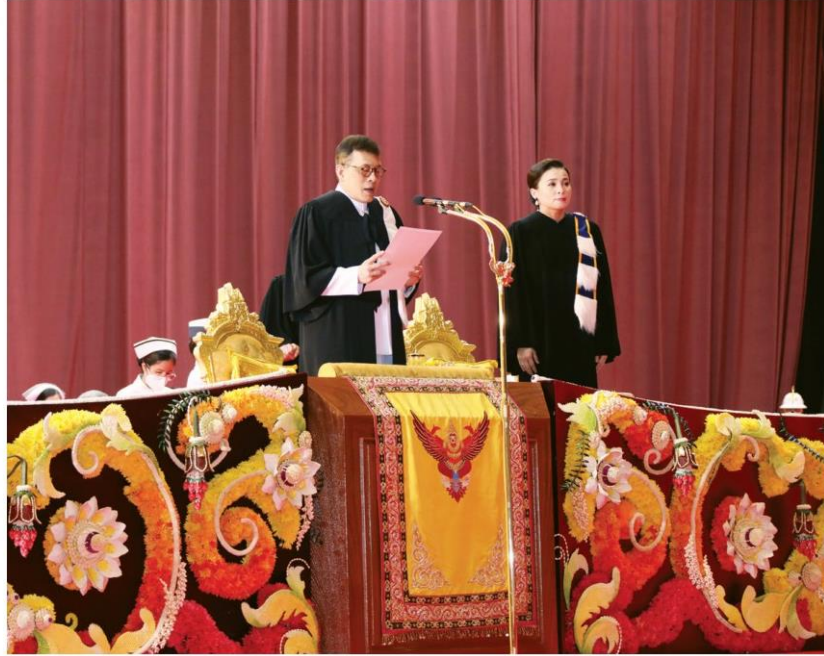
พระบาทสมเด็จพระเจ้าอยู่หัว พระราชทานพระบรมราโชวาทแก่บัณฑิต

หัวข้อข่าว: ในหลวง-พระราชินี เสด็จฯไปทรงเปิดอาคารกิติยาคาร