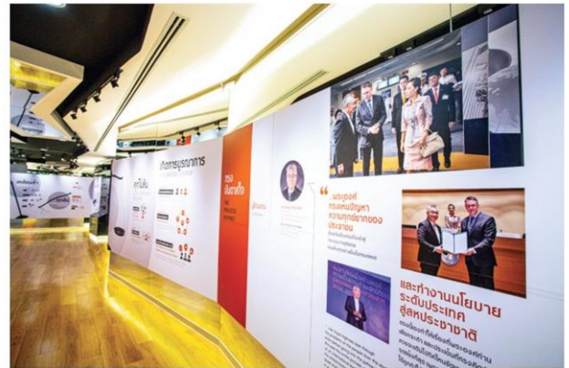
นิทรรศการเฉลิมพระเกียรติสมเด็จพระเจ้าลูกเธอ เจ้าฟ้าพัชรกิติยาภา นเรนทิราเทพยวดี กรมหลวงราชสาริณีสิริพัชร มหาวัชรราชธิดา