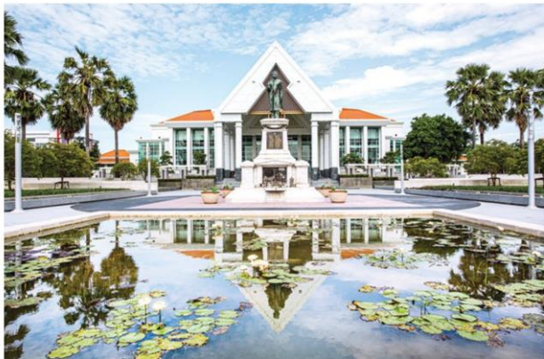
อาคาร “กิติยาคาร”