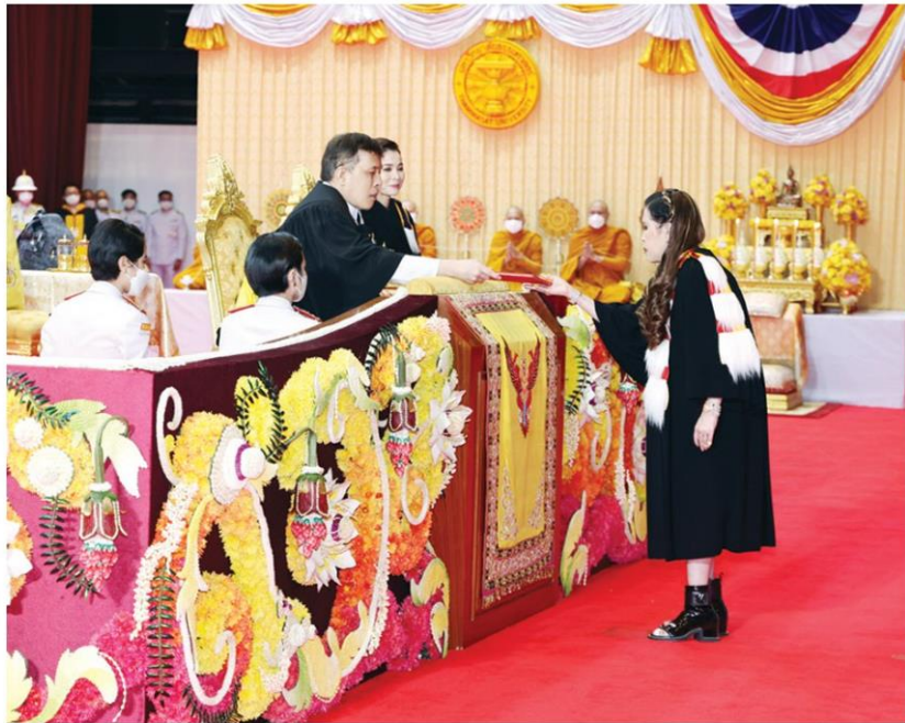
สมเด็จพระเจ้าน้องนางเธอ เจ้าฟ้าจุฬาภรณวลัยลักษณ์ อัครราชกุมารี กรมพระศรีสวางควัฒน วรขัตติยราชนารี เฝ้าทูลละอองธุลีพระบาท รับพระราชทานปริญญาบัตรคุณวุฒิปบัณฑิตกิตติมศักดิ์ (สาขาวิชาเคมี)