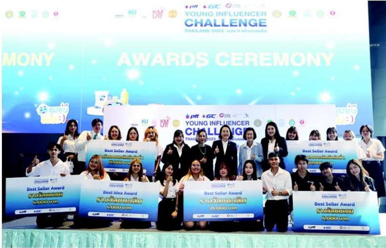
ที่สร้างอนาคตของชาติต่อไปด้วย สำหรับรางวัลในการแข่งขันโครงการ Young Influencer Challenge Thailand 2023 ประกอบด้วย รางวัลสุดยอดนักขาย

(Best Seller Award) จำนวน 5 รางวัล โดย บริษัท ปตท. จำกัด (มหาชน) มอบรางวัลทีมที่ยอดจำหน่ายสูงสุด มูลค่า 25,000 บาท และมอบ รางวัลสุดยอดไอเดียการตลาด (Best Idea Award) จำนวน 1 รางวัล มูลค่า 5,000 บาท ซึ่งมีการประชันไอเดียจาก 4 ทีมที่มีแผนการตลาดโดดเด่น โดยไม่เกี่ยวกับยอดขาย เพื่อตัดสินรางวัลภายในพิธี โดยมีรายชื่อทีมผู้ชนะ ดังนี้