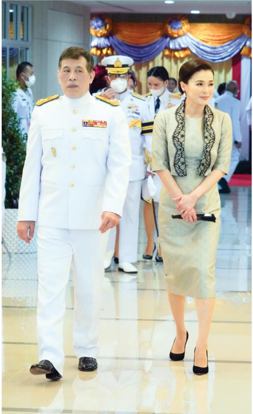
พระบาทสมเด็จพระเจ้าอยู่หัว และสมเด็จพระนางเจ้าฯ พระบรมราชินี เสด็จพระราชดำเนินไปทรงเปิดอาคารกิติยาคาร ณ มหาวิทยาลัยธรรมศาสตร์ ศูนย์รังสิต

พิธีพระราชทานปริญญาบัตรแก่ผู้สำเร็จการศึกษาจากมหาวิทยาลัยธรรมศาสตร์ ประจำปีการศึกษา 2564 จากมหาวิทยาลัยธรรมศาสตร์ มีผู้สำเร็จการศึกษา จำนวนทั้งสิ้น 9,497 คน ประกอบด้วยผู้สำเร็จการศึกษาระดับปริญญาตรี 8,062 คน ปริญญาโท 1,304 คน ปริญญาเอก 113 คน และระดับประกาศนียบัตร 18 คน ในงานนี้ สภามหาวิทยาลัยธรรมศาสตร์ มีมติทูลเกล้าฯ ถวายปริญญาปรัชญาดุษฎีบัณฑิตกิตติมศักดิ์ สาขาวิชาเคมี และผู้ทรงคุณวุฒิอีก 7 ราย เชาว์รับพระราชทานปริญญาบัตรกิตติมศักดิ์