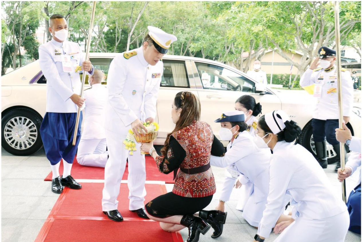
สมเด็จพระเจ้าน้องนางเธอ เจ้าฟ้าจุฬาภรณวลัยลักษณ์ อัครราชกุมารี กรมพระศรีสวางควัฒน วรขัตติยราชนารี เฝ้าฯรับเสด็จ

อาคาร "กิติยาकार" เป็นอาคารหอประชุมหลัก และอาคารหอประชุมเล็ก ซึ่งได้รับพระราชทานชื่ออาคารจากสมเด็จพระเจ้าลูกเธอ เจ้าฟ้าพัชรกิติยาภา นเรนทิราเทพยวดี กรมหลวงราชสาริณีสิริพัชร มหาวัชรราชธิดา เดิมเป็นอาคารยิมเนเซียม 1 ที่ใช้เป็นสถานที่สำหรับการแข่งขันกีฬาเอเชียนเกมส์ ครั้งที่ 13 เมื่อปี 2541 และใช้ประโยชน์ในกิจกรรมกีฬา การเรียนการสอน และ