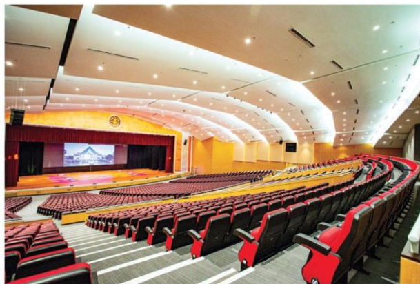
ห้องประชุมสัมมนา