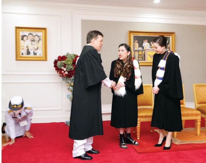
พระบาทสมเด็จพระเจ้าอยู่หัว และสมเด็จพระนางเจ้าฯ พระบรมราชินี ทรงร่วมยินดีกับสมเด็จพระเจ้าน้องนางเธอ เจ้าฟ้าจุฬาภรณวลัยลักษณ์ฯ ในโอกาสรับพระราชทานปริญญาบัตรคุณฐิภัณฑิลาทิตติมศักดิ์

หัวข้อข่าว: ในหลวง-พระราชินี เสด็จฯไปทรงเปิดอาคารกิติยาคาร